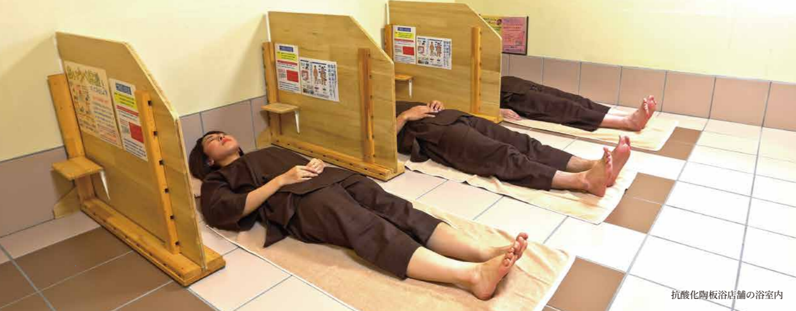
抗酸化陶板浴店舗の浴室内

プライベート陶板浴のものである「抗酸化陶板浴」は、体の冷えを取って温まりたい、リフレッシュして元気に過ごしたいというお客様の健康づくりに貢献するため生まれました。暑すぎずほどよい暖かさで、湿度も低くカラッと。息苦しさを感じにくく、空気環境を改善する自社開発技術により、心地よく過ごせるきれいな空気の空間です。