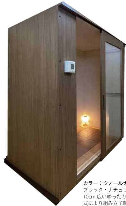
カラー：ウォールナット NEW ブラック・ナチュラルより奥行が10cm広いゆったり設計*。パネル式により組み立て時間も短縮。

約1畳分のスペースと200Vのコンセントがあれば設置可能。組み立ててコンセントに繋ぐだけで、ご自宅やお店の一角が気持ち良い温熱浴コーナーに早変わり。抗酸化陶板浴の特長はそのままに、個室型で他人の視線を気にせずゆったりとくつろげます。