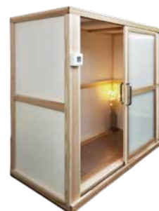
カラー：ナチュラル リバースワックス塗装により、杉材の香りがやわらかく香ります。