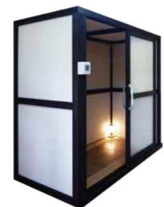
カラー：ブラック 黒色塗料には、特有のにおいを低減する加工を施しています。

朝でも夜でも好きな時間に、好きなだけ入ることができる自分専用の陶板浴がご自宅に完成。音楽を聴きながら、映画を見ながらなど、過ごし方も自由自在です。